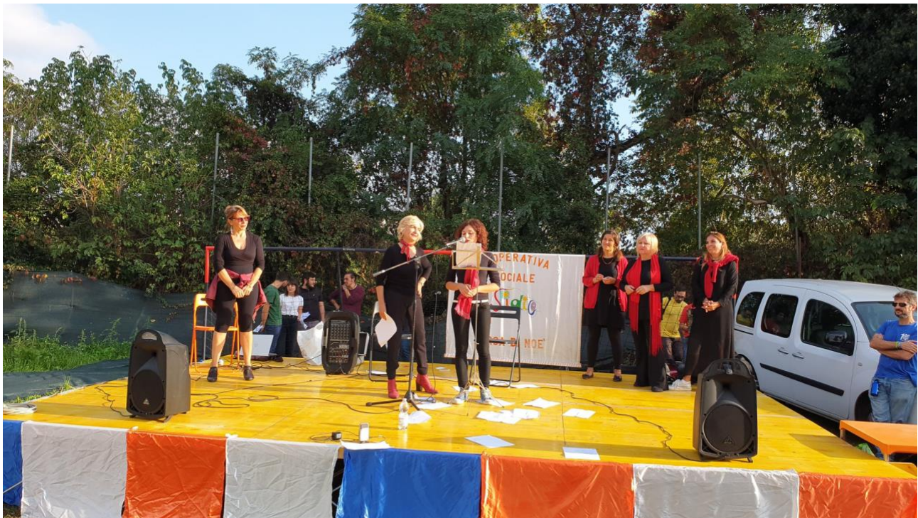
Reading da "Ferite a morte" di Serena Dandini, per l'iniziativa "La Comunità SiCura", incontro delle Associazioni attive nel IV Municipio di Roma